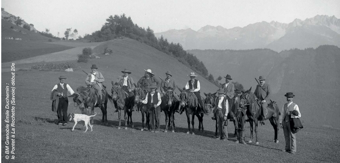
© BM Grenoble Émile Duchemin : le Pontet à La Rochette (Savoie) début 20e

Sur un marché toujours porteur, encore aujourd'hui soutenu par les demandes espagnoles et italiennes, les nouveaux débouchés s'ouvrent ainsi doivent contribuer à stimuler et amplifier les projets individuels et collectifs.